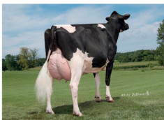
Golden-Oaks Atwood Charla, favoriete Champ Rae-dochter op Golden-Oaks.